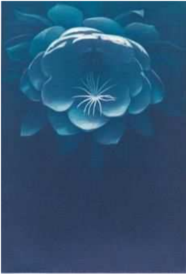
幻花 II | 2001 | メゾチント (2版2色刷り)

上天天堂など) が登場するのです。これには、メゾチントの光の表現が、渡辺に聖性や神秘性を喚起した可能性が考えられますが、より直接的には、1996年に島原半島の有家町（現・南島原市）からの依頼で行った16世紀末のキリシタン版画《セビリアの聖母》の復刻の仕事の影響と思われる（この仕事については渡辺の著書『殉教の刻印』小学館、2001年/長崎文献社、2013年）。その他、月下美人をはじめ様々な植物が取り上げられていますが、暗闇の中にただ存在する、といった風情の植物たちは、普遍的な、生と死、あるいは宇宙の観念のようなものを反映しているようでもあります。こうした境地に達したのは、やはり聖母復刻の作業を体験したためかもしれません。渡辺の最後のメゾチント作品の一つ、《長崎情景(殉教の丘から)》は、繊細な青のモノクロームの中、長崎・西坂からの眺望に椿が象徴する26聖人殉教のイメージを重ねたものです。